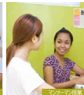
マンツーマン授業