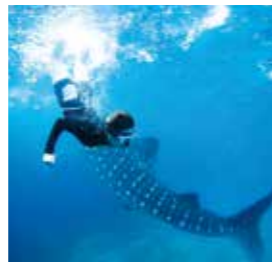
From. Banilad Nemo

If you want to study English in an environment where there are not many Japanese, I recommend CG. These past 12 weeks were precious experiences for me.