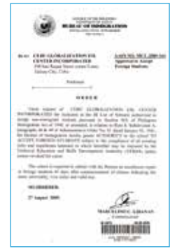
フィリピン移民局SSP