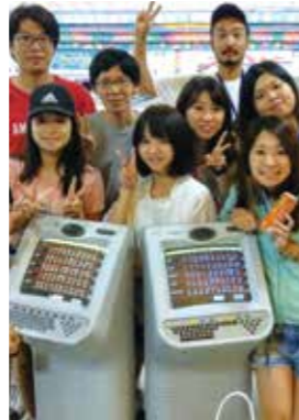
From. Sparta Sky

I had a nice time in CG for 1month. CG has strict rule that pushes me to study. For example, EOP(English only policy), and I can't go out during week days. I think that I can't have the chance to put myself in this strict environment again. You may think "Isn't it too strict?," There are humorous teachers, a lot of friends from other countries, cheering each other, and having some time to play made me not to think that it's hard to endure. I can study English practically, different from the one that I can learn in Japan. So, I could get TOEIC score surprisingly higher than before. Thanks to everyone in CG. If you're hesitating, I recommend you to study in CG!